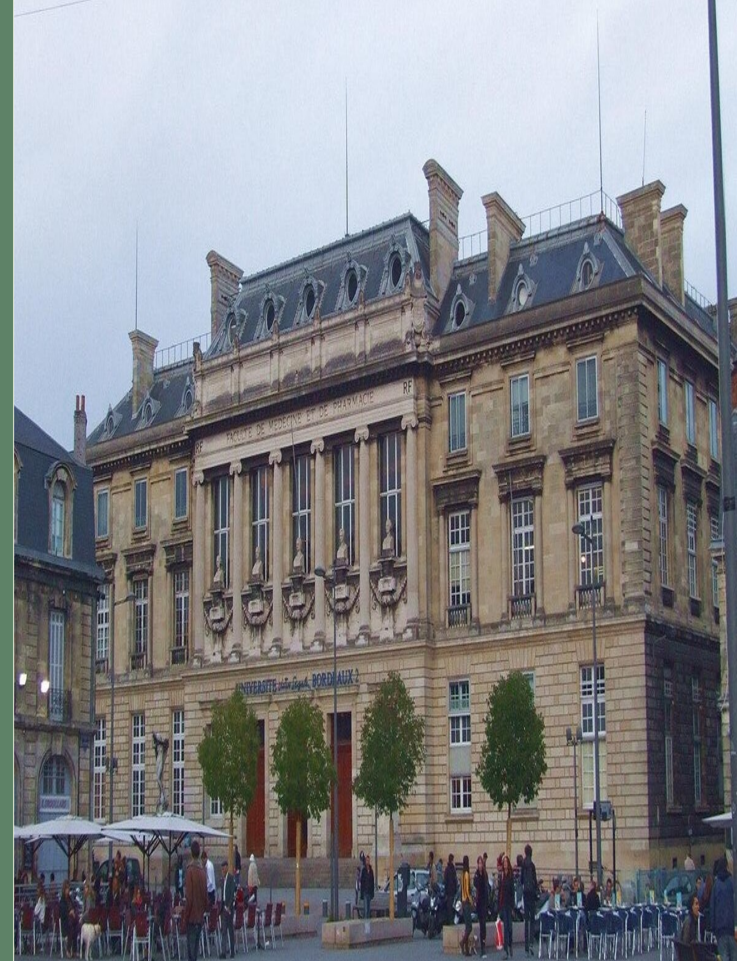
Università de Bordeaux (Francia)