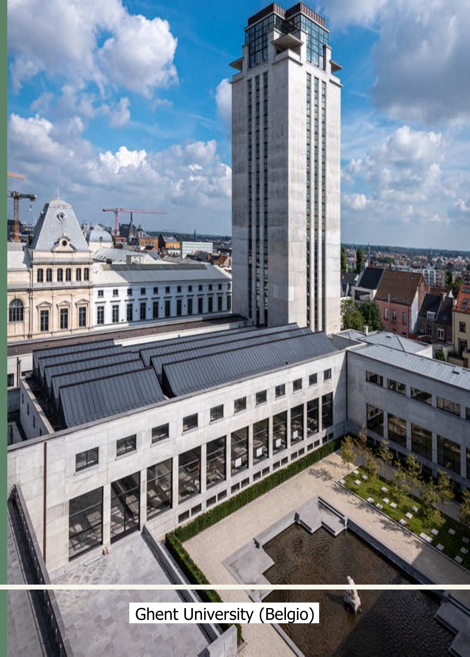
Ghent University (Belgio)