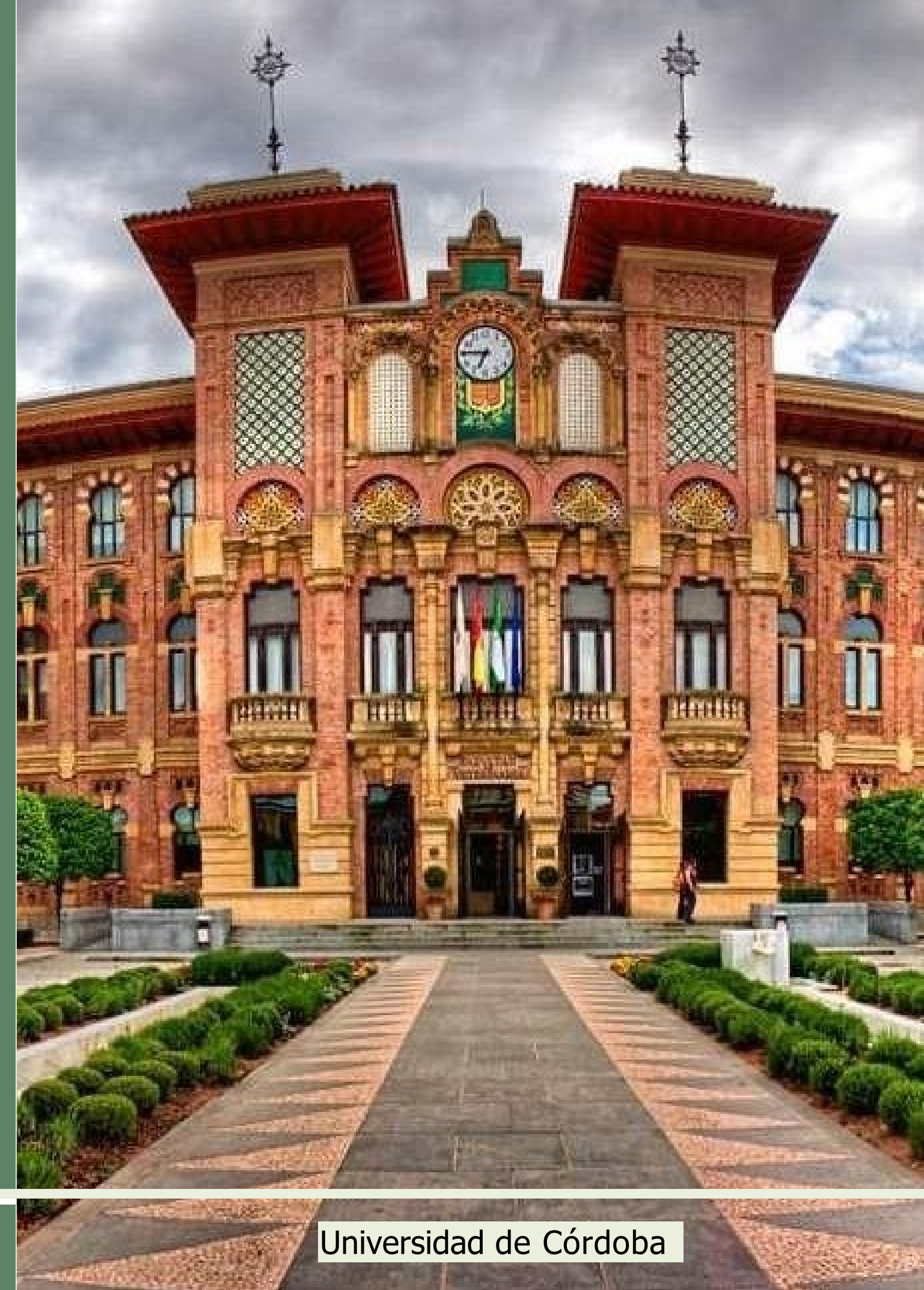
Universidad de Córdoba

➔ Svolgere ATTIVITÀ PROGRAMMATE nell'ambito dei dottorati di ricerca/master /scuole di specializzazione