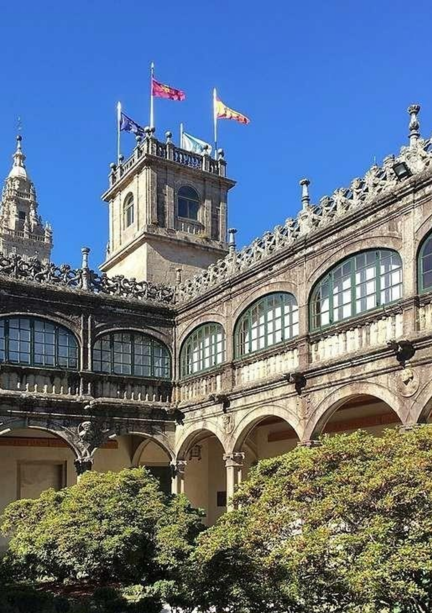
Universidade de Santiago de Compostela