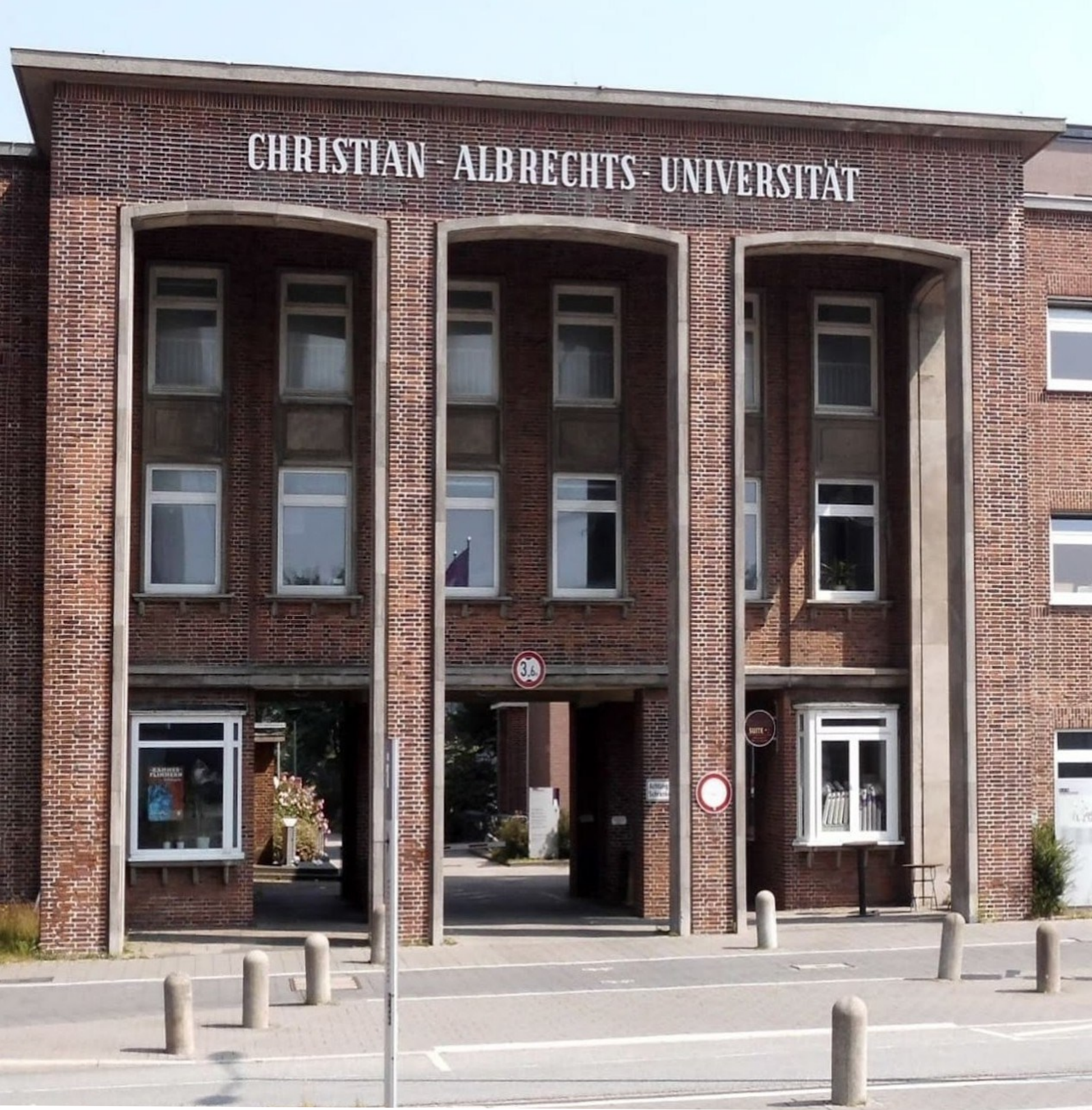
Kiel University (Germania)